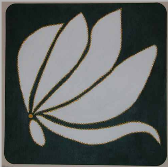
Talbeaux de André Mas