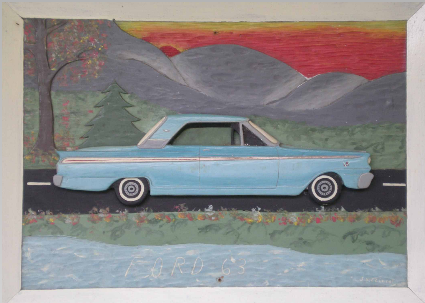
FORD 63 Joliette P Canada