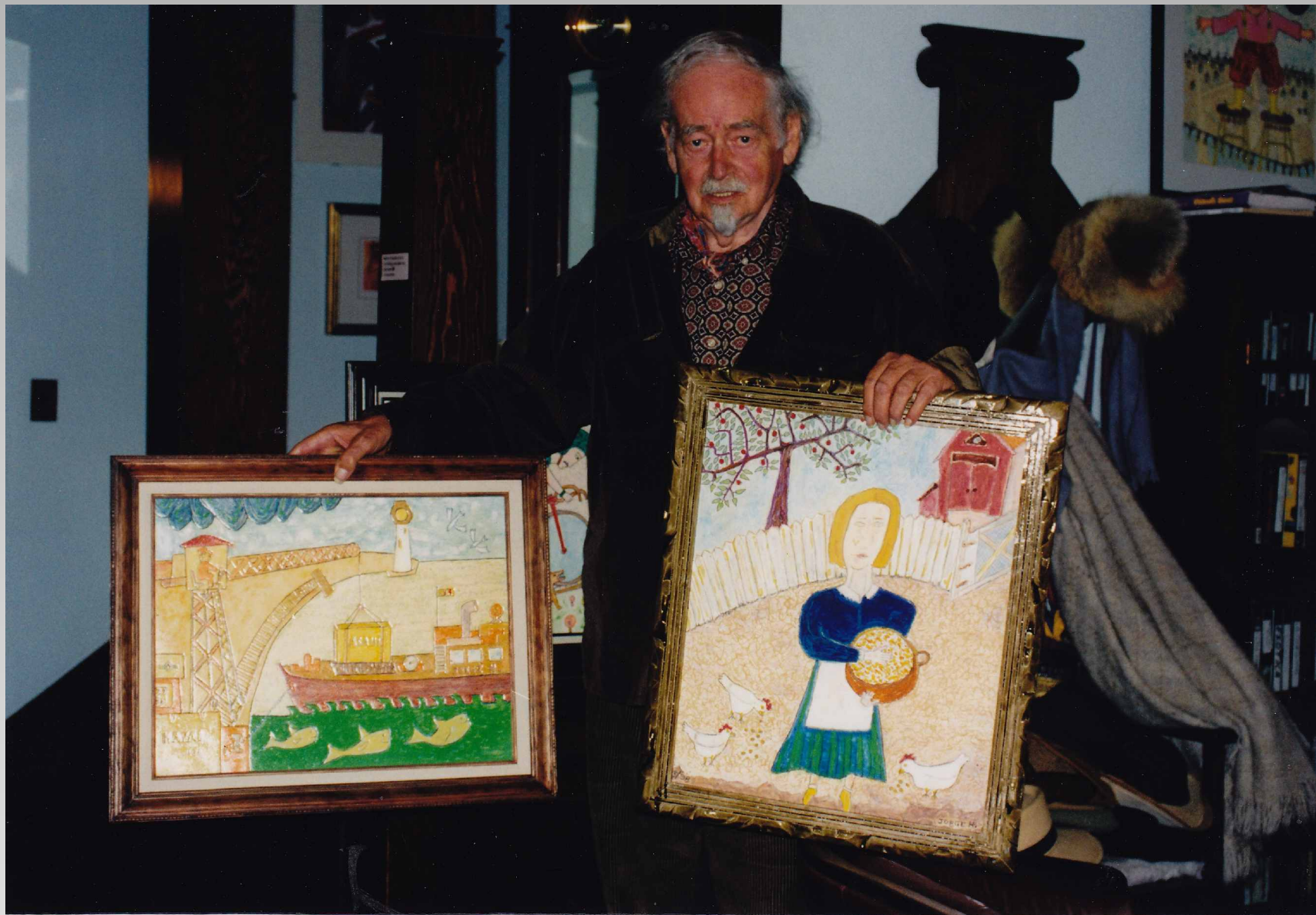
L'artiste Jorge WITCHCOCK, qui a peint le tableau WEIGHT LIFTER ( page précédente)