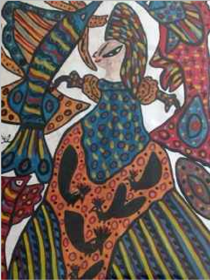
«GRANDE DAME» Baya (Fatma Abbad) Algérie

...Appelés parfois «peintres du dimanche», ils ne sont jamais des peintres professionnels. A travers leur métier, ces artistes traduisent leur existence modeste et la réalité populaire en utilisant des formes simples et des couleurs vives, souvent contrastées, sans aucune connaissance de la perspective.